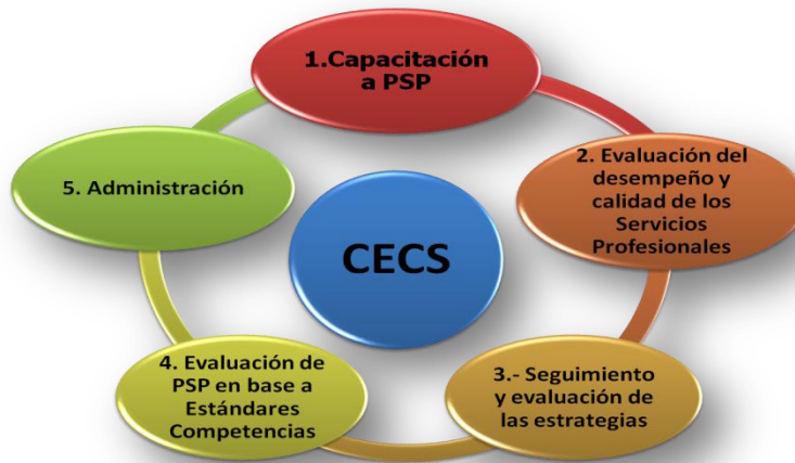
Figura 12.1.4 Funciones Sustantivas del CECS-Chihuahua, anidado en la FZYE